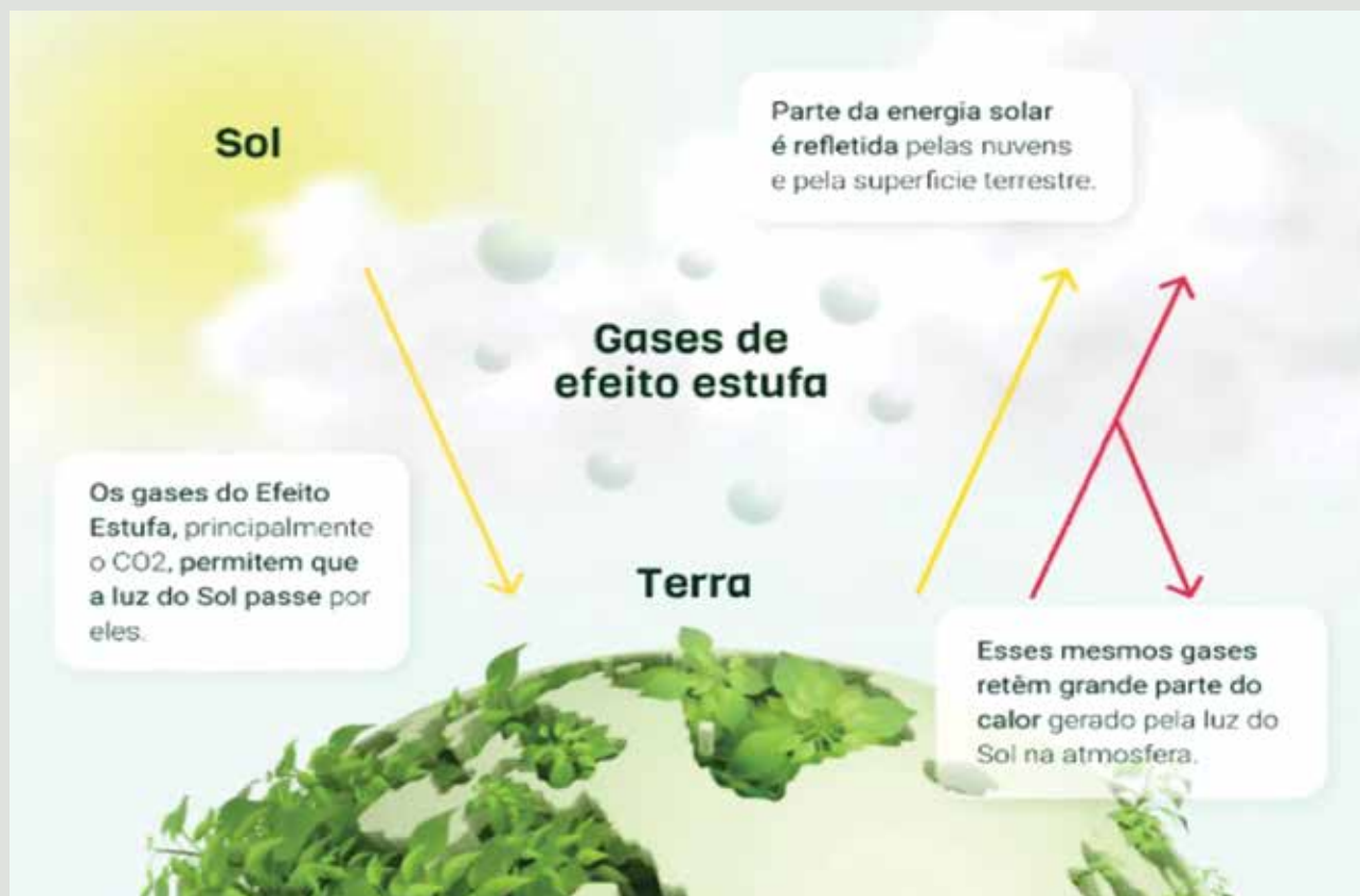
■ FIGURA 1. ESQUEMA DE GEE

■ Conseqüentemente, há um consenso crescente sobre a necessidade premente de reduzir essas emissões para descarbonizar a economia e atingir as metas estabelecidas no Acordo de Paris. O mercado de carbono é também conhecido como o mercado onde ocorrem transações de licenças de emissão de gases poluentes. Na prática, este mercado permite a compra e venda de licenças que permitem a poluição. O maior mercado é o da Europa e tem o nome de CELE – Comércio Europeu de Licenças de Emissão (Directiva 2003/87/CE, de 13 de Outubro). Estes mercados surgiram após a criação da