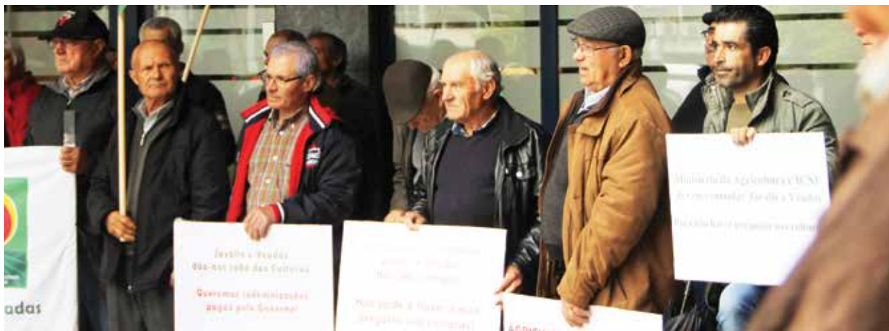
■ CONCENTRAÇÃO DE AGRICULTORES LESADOS (ABRIL 2019, COIMBRA, JUNTO À DRAPC)