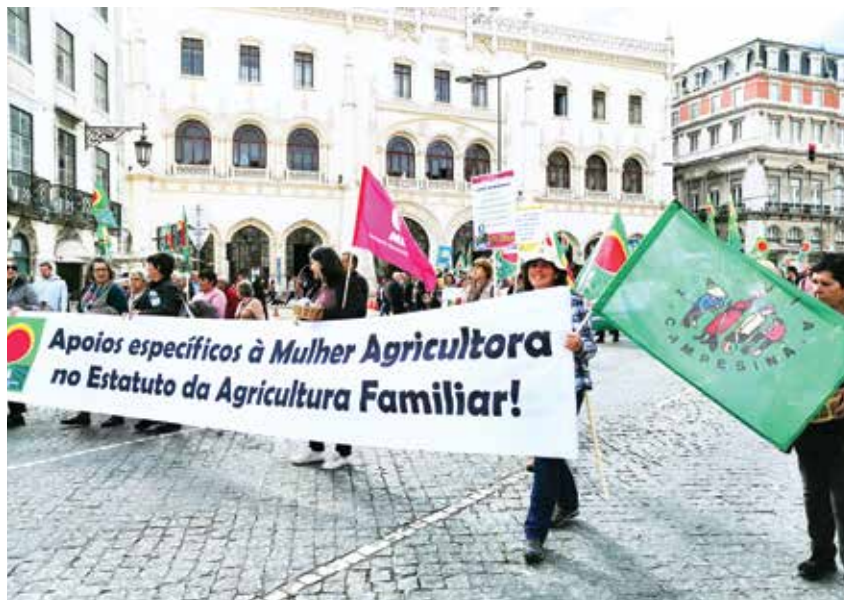
■ MANIFESTAÇÃO NACIONAL DE MULHERES (8 MARÇO DE 2020, LISBOA)

A Assembleia Geral das Nações Unidas (ONU) declarou 2026 como o Ano Internacional da Mulher Agricultora, decisão que a CNA saúda, exortando o Governo a adotar políticas que valorizem o papel essencial das mulheres no sector agrícola e nos territórios rurais e que ponham fim a todas as formas de discriminação e violência.